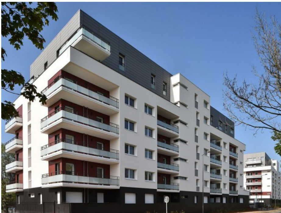
Les Claustras du Coteau © Logement Francilien