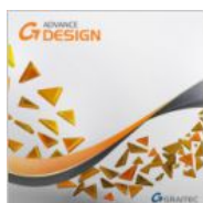
Advance Design GRAITEC